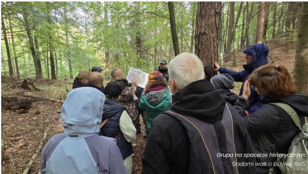
Grupa na spacerze historycznym: Śladami walk o Gdynię 1945.