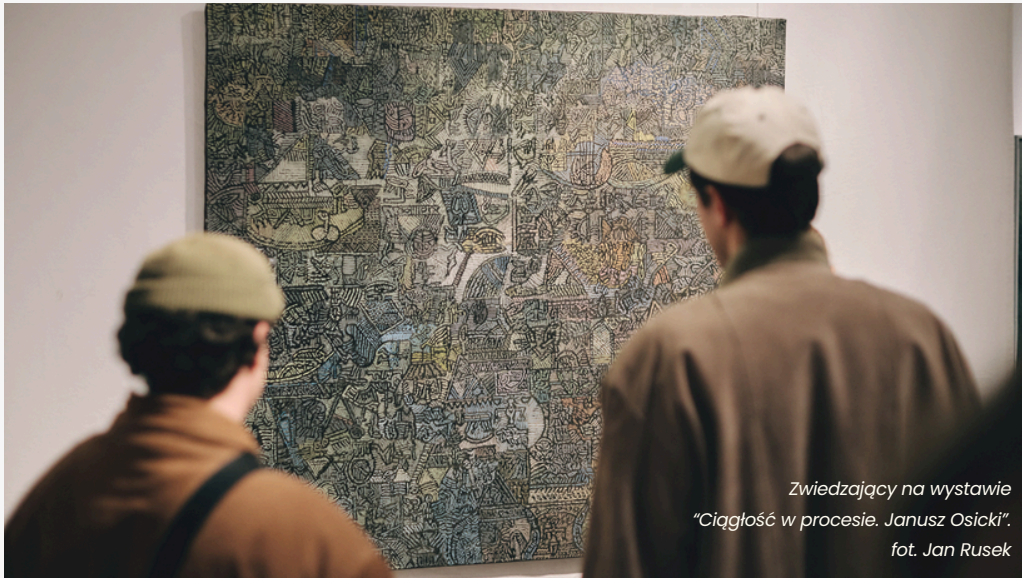
Zwiedzający na wystawie "Ciągłość w procesie. Janusz Osicki".