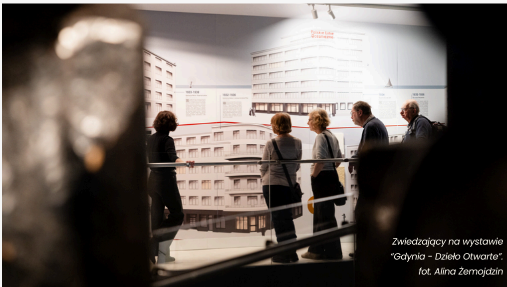
Zwiedzający na wystawie "Gdynia - Dzieło Otwarte".